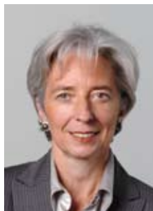
Christine LAGARDE Minister for Economy, Finance and Employment Ministre de l'Économie, des Finances et de l'Emploi

Quelle que soit la taille de votre entreprise, je vous invite à participer à ce Forum, et je vous encourage à saisir cette formidable chance que représente ITER pour les entreprises européennes, pour l'économie nationale et régionale, pour la croissance et l'emploi.